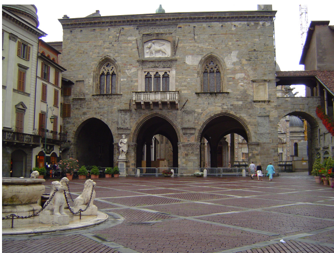
Piazza Vecchia, Bergamo

The holders of 41 UNESCO Chairs in human rights, democracy, bioethics, peace and tolerance, active in all continents, met at the University of Bergamo (2-4 March 2011) on initiative of the local Chair and of the UNESCO General Direction, in order to discuss on the theme "Developing together a new partnership for strengthened cooperation".