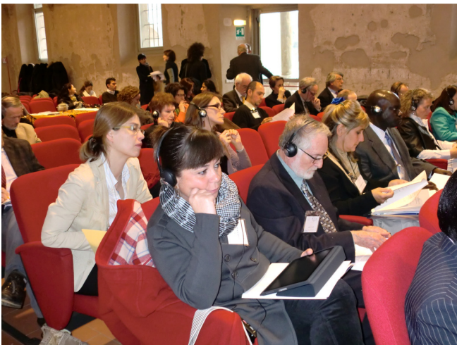
Plenary Session of the meeting, Bergamo Complesso San Agostino

If you want more information about this meeting please visit this page ^ : http://www.data.unibg.it/dati/bacheca/959/49436.pdf