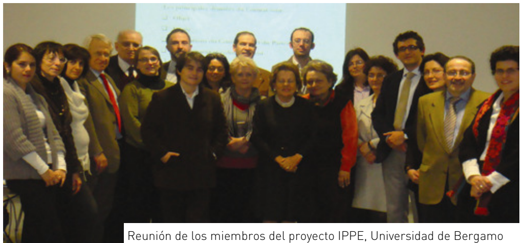
Reunión de los miembros del proyecto IPPE, Universidad de Bergamo

Los derechos colectivos es esencialmente el derecho de participación de los padres en las estructuras formales organizadas por el sistema educativo.