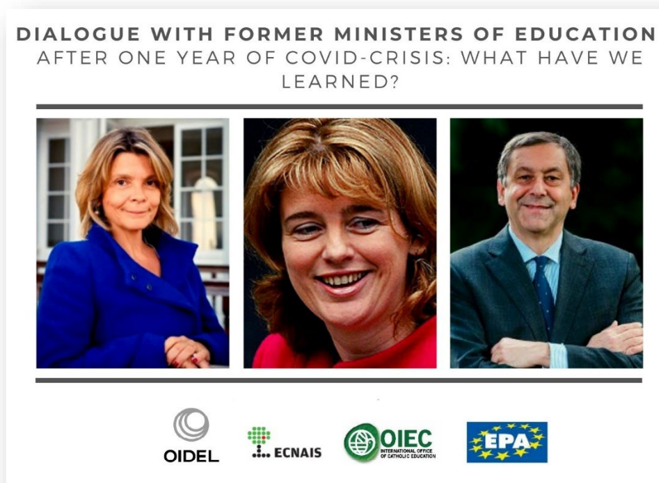
Maria do Carmo Seabra

El 11 de mayo de 2021, OIDEL organizó, en colaboración con OIEC, ECNAIS y EPA, un coloquio online con los ex ministros de educación Maria do Carmo Seabra, de Portugal, Ruth Kelly, de Reino Unido y Francesco Profumo, de Italia.