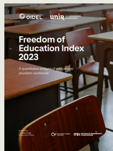
Couverture de l'Indice de liberté de l'éducation 2023

Une part centrale du travail d'Oïdel tout au long de l'année 2025 a été consacrée à la diffusion et à la présentation de ces résultats auprès des décideurs politiques, des experts académiques et des acteurs de la société civile. Voici ci-dessous quelques-unes des principales présentations réalisées.