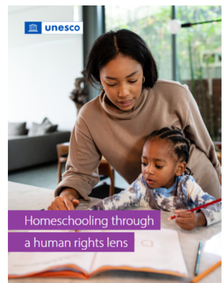
Rapport de l'UNESCO : « Homeschooling through a human rights lens »

https://www.unesco.org/en/articles/what-you-need-know-about-homeschooling-through-human-rights-lens