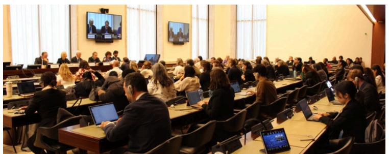
Événement parallèle « La famille comme pierre angulaire : préserver le rôle des parents dans la garantie du droit à l'éducation »

Dans le cadre de la 60e session du Conseil des droits de l'homme des Nations Unies, tenue à Genève, OïDEL a coorganisé, le 16 septembre 2025, un événement parallèle intitulé « La famille comme pierre angulaire : préserver le rôle des parents dans la garantie du droit à l'éducation ». L'événement s'est tenu au Palais des Nations et a réuni plus de 80 participants.