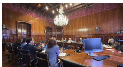
Parlement de Catalogne