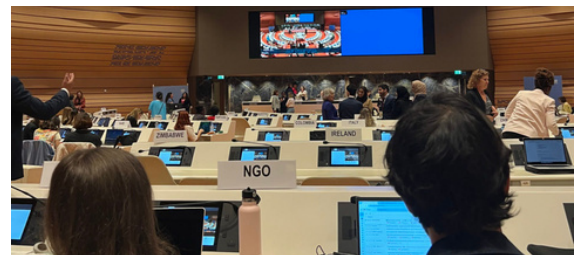
Première session du Groupe de travail intergouvernemental sur un protocole facultatif au droit à l'éducation

Au Palais des Nations des Nations Unies, la première session du Groupe de travail intergouvernemental à composition non limitée s'est tenue afin d'examiner la possibilité d'un protocole facultatif à la Convention relative aux droits de l'enfant portant sur le droit à l'éducation de la petite enfance, ainsi que sur la gratuité de l'éducation préprimaire et de l'enseignement secondaire.