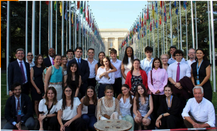
Participants de la 3e Université d'été « Droits humains et éducation »

OIDEL a organisé, pour la troisième année consécutive, l'Université d'été sur les droits humains et l'éducation, en collaboration avec le département ERDIE de l'Université de Genève et la Global Human Rights Clinic de Notre Dame Law School. Pendant quatre jours, 25 participants issus de différentes universités et organisations ont pris part à des sessions consacrées au droit à l'éducation et aux principes internationaux relatifs aux droits humains, renforçant leurs réseaux et acquérant des outils pour promouvoir l'éducation comme un droit humain aux niveaux local et mondial.