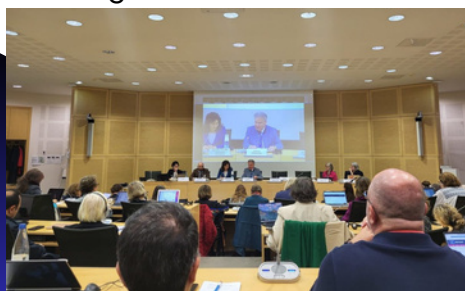
Conférence des ONG

Lors de la session d'automne, les défis croissants auxquels sont confrontées les ONG dans plusieurs pays ont été mis en lumière, et les recommandations des commissions des ONG ont été présentées et adoptées. Parmi les obstacles mentionnés figuraient des exigences bureaucratiques excessives justifiées au nom de la transparence, des sanctions pour avoir critiqué les gouvernements, et même des attaques discrètes contre les comptes bancaires des organisations.