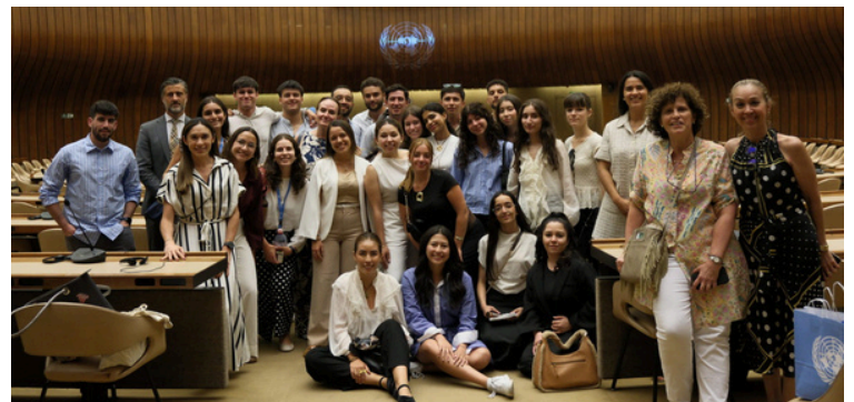
Participants du cours « Femmes, paix et sécurité »

OIDEL, en collaboration avec l'Université de La Rioja, a organisé le cours d'été sur les femmes, la paix et la sécurité à l'occasion du 25e anniversaire de la Résolution 1325 du Conseil de sécurité des Nations Unies. Pendant une semaine, des étudiants en droit de l'Universidad de La Rioja (Espagne) et de l'Universidad de La Sabana (Colombie) se sont réunis à Genève afin d'approfondir le rôle des femmes dans la consolidation de la paix et les initiatives de sécurité.