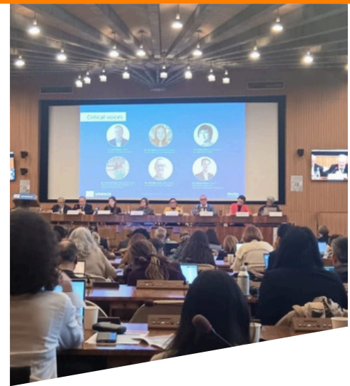
Symposium international sur l'avenir du droit à l'éducation

L'UNESCO a organisé le Symposium international sur l'avenir du droit à l'éducation : renouveler les engagements mondiaux et tracer la voie à suivre. L'événement a commémoré le 65 e anniversaire de la Convention de 1960 concernant la lutte contre la discrimination dans le domaine de l'enseignement, a officiellement clôturé la 11 e consultation sur cette Convention et a été marqué par le lancement du Rapport mondial 2025 sur le droit à l'éducation. Il a réuni des responsables politiques, des organisations internationales, des universitaires et la société civile afin d'évaluer les progrès accomplis, les défis émergents et de relancer la dynamique autour du droit universel à l'éducation.