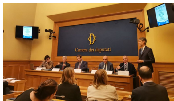
Chambre des députés d'Italie

Dans la salle de presse de la Chambre des députés d'Italie, OIDEI a présenté l'Indice de liberté de l'éducation lors d'un événement organisé par LABORA, qui a réuni des intervenants et des autorités politiques et a mis en lumière l'urgence de renforcer le pluralisme éducatif dans le pays, conformément à l'article 26(3) de la Déclaration universelle des droits de l'homme, qui reconnaît le droit des parents de choisir l'éducation de leurs enfants.