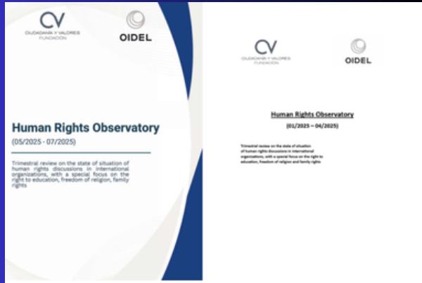
Éditions du rapport « Human Rights Observatory » : 01/2025-04/2025 et 05/2025-07/2025

OIDEL publie chaque année une série de rapports périodiques afin de rapprocher la société civile de l'état actuel des débats internationaux en matière de droits humains, avec une attention particulière portée au droit à l'éducation, à la liberté religieuse et au rôle de la famille.