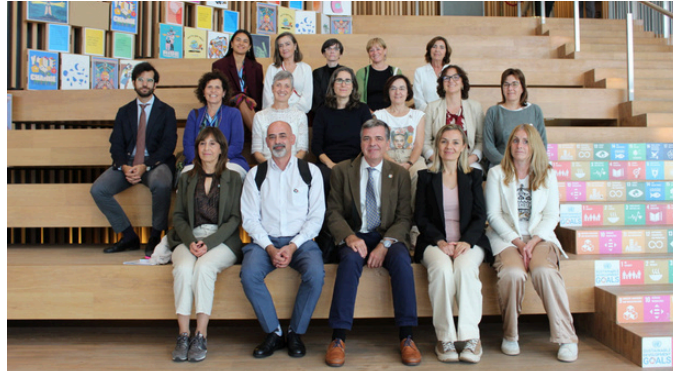
Participants de la formation « Modernisation institutionnelle et gouvernement numérique dans le cadre de l’Agenda 2030 »

Genève (Suisse), du 15 au 17 septembre 2025